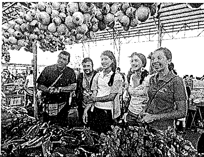
Abbildung 2 Visita en la feria de Desamparados con el equipo de trabajo

Se realizaron visitas las ferias de Desamparados y la de Tres Ríos. Se experimentó los espacios de las ferias en el papel de una turista, investigando el carácter intercultural de la feria, las fuentes de informaciones que hay en éstas y la identidad cultural y nacional que muestran las ferias.