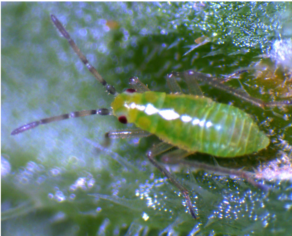
Figura 3. Áfido ( Aphis gossypii ).