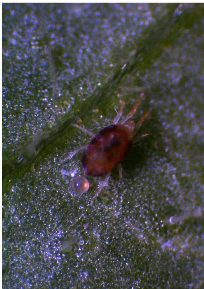
Figura 1. Arañita roja ( Tetranychus spp.).

A continuación, se presentan las fotografías de algunas de las plagas y enfermedades encontradas en plantas de ayote, en diferentes zonas de Costa Rica.