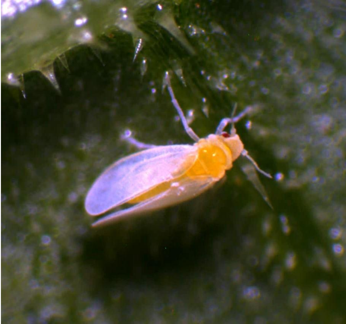
Figura 4. Mosca blanca ( Bemisia tabaci ).