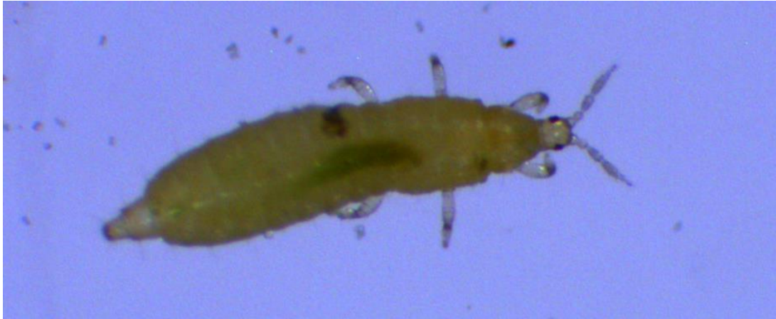
Figura 2. Trips ( Thrips palmi ).