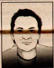
ASDRÚBAL MARÍN MURILLO *

ginalidad, la honestidad, la decencia, la dignidad, el valor y la ética de los pueblos autóctonos de nuestro continente. En él se encarna la humildad, el deseo de triunfo, la transparencia, la ilusión, la esperanza, el respeto y el amor por los humildes y los que menos tienen. Es el reconocimiento que un latinoamericano honrado hace a los abandonados por el gran capital, por la avaricia, el individualismo y el egoísmo de una sociedad centrada en el consumo y el tener. Centrada en la apariencia. Evo Morales encarna el rompimiento con el pasado, sintetiza la fe, la lucha, la dignidad, el horizonte, la meta, la ilusión y la esperanza de un mundo mejor, más honesto y más humano. Rompe con el gran capital privatizador y le abre las puertas a la socialización del progreso y el desarrollo. El presidente Morales es una puerta más que conduce al continente latinoamericano hacia "el socialismo del nuevo siglo". Evo Morales está muy lejos de representar "el nuevo racismo de los indios contra los blancos", como lo quiere hacer ver Vargas Llosa, ese gran parásito del sistema. Lo que Evo sí representa es la confrontación de la justicia contra la injusticia, de la verdad contra la mentira, de la equidad contra la explotación, de la honradez contra la corrupción. Es la lucha de la dignidad, el decoro, la decencia y la integridad contra la ruindad, la mezquindad y la abyección. □