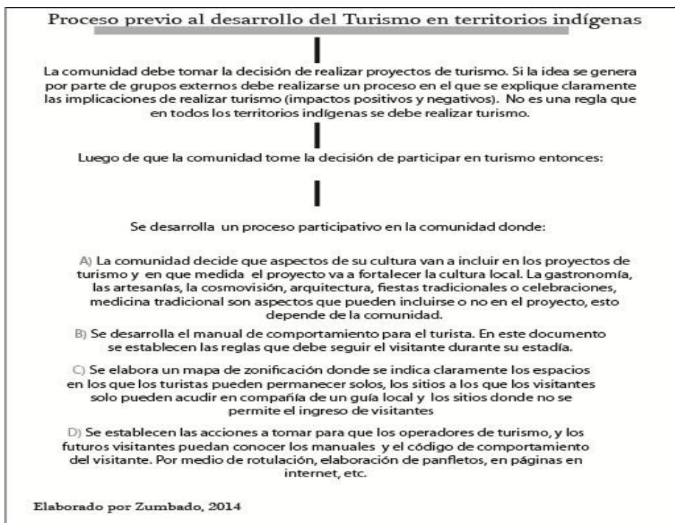
Figura Nro. 2. Proceso previo antes de implementar un proyecto de turismo.

Durante este proceso participativo que deben realizar las comunidades indígenas, antes de iniciar con etnoturismo, se debiese establecer también qué elementos de su cultura van a destacar ante los visitantes en el proyecto de turismo. Muchos proyectos pueden basarse solo en alimentación, artesanías, cosmovisión a nivel general o un resumen del estilo de vida. Este aspecto es de