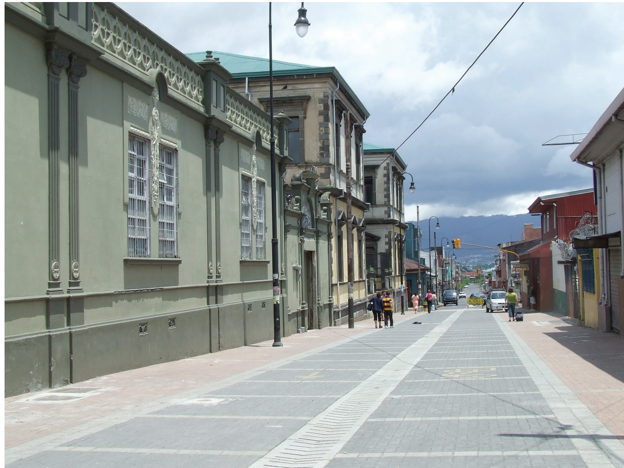
Fotografía boulevard peatonal, San José.

Antigua Fábrica de Licores, Edificio de Correos, La Casa Amarilla, la sede de la Embajada de México, la escuela Metálica, el Colegio de Señoritas, el Colegio Sión, la Antigua Aduana, el Museo Nacional, la Estación al Pacífico, y al Atlántico, y unos pocos más.