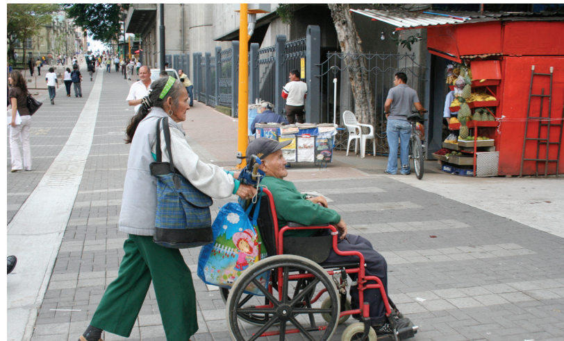
Fotografías boulevard peatonal, San José. © Instituto de Arquitectura Tropical