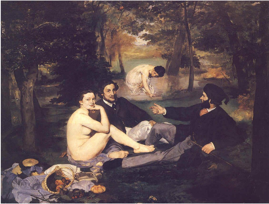
Édouard Manet, Le Déjeuner sur l'Herbe (1863). Óleo sobre lienzo, 208 cm x 264,5 cm. Musée d'Orsay, París.

Podríamos imaginar la historia de la siguiente manera: Se trata de un fin de semana agradable y soleado, y dos parejas de enamorados hacen un plácido paseo en bote por el Sena. En una de sus vueltas el río pasa cerca de un pequeño bosque y los paseantes deciden detenerse allí para hacer un picnic a la sombra de los árboles; las mujeres aprovechan la oportunidad para meterse en el agua, después de lo cual una de ellas, desnuda, espera que la tibia brisa le seque la piel, mientras que los hombres conversan. Puede ser que las mujeres traten en vano de seducir a los hombres que no se dejan distraer, inmersos en un intercambio de información sobre la próxima carrera de caballos en el hipódromo de Auteuil. Una de las mujeres, ofendida ante la indiferencia masculina, se dirige a nosotros, espectadores de la escena, en busca de consuelo.