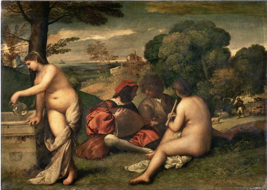
Tiziano Vecellio, Concierto Campestre (1509). Óleo sobre lienzo, 105 cm x 137 cm. Musée du Louvre, París.

Manet tenía la mirada fija en la piel de las mujeres que salían del agua. Pareciera –dijo– que tenga que hacer un desnudo. Bueno, les voy a hacer uno. Cuando estábamos en el taller, copié las mujeres de Giorgione, las mujeres con los músicos. Está muy oscuro ese cuadro. El fondo ha vuelto a la superficie de la tela. Quiero hacer esto de nuevo pero hacerlo en una atmósfera transparente, con personajes como los que vemos allí. Me van a demoler. Van a decir que me inspiro de los italianos después de haberme inspirado en los españoles (Proust, 1996).