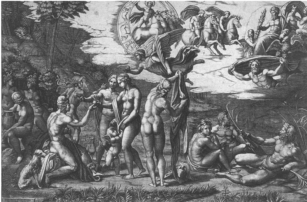
Marcantonio Raimondi, El juicio de Paris (1515). Grabado, buril, 29,4 cm x 43,8 cm. Musée du Louvre, París.

en el extremo derecho, con dos hombres y una mujer en actitudes casi idénticas a las del Déjeuner sur l'herbe .