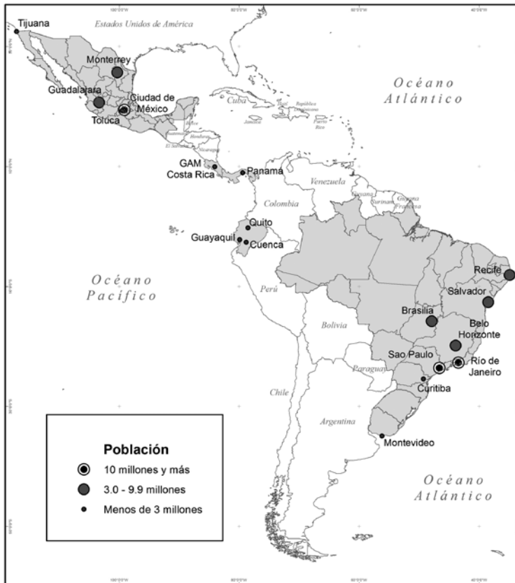
Mapa 1 Zonas metropolitanas de estudio, según tamaño demográfico en el censo de la ronda de 2010

en el censo de Panamá, entonces se optó por usar esta escala y no otra más desagregada y precisa, como corregimiento o incluso manzana.