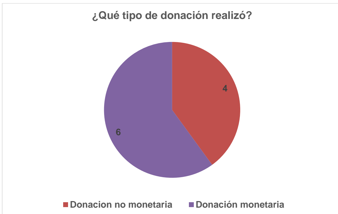
Figura 3: Gráfico de tipo de donaciones realizadas.

En la figura 3 se muestra el tipo de donación realizada por las diez personas que realizaron donaciones en el último año, la mayoría, seis en total, realizaron donaciones no monetarias, principalmente voluntariado y solo cuatro personas realizaron donaciones de dinero.