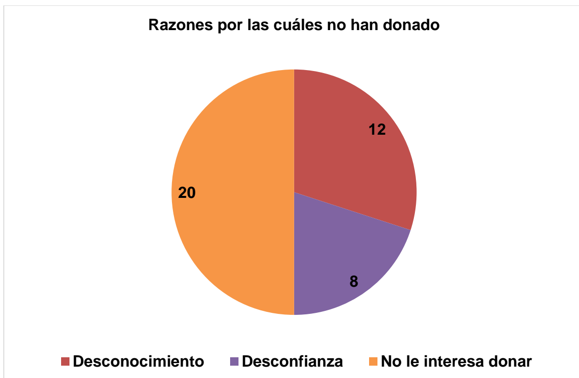
Figura 2: Gráfico de razones por la cuáles las personas no han realizado donaciones.

La figura 1 muestra la posición de los encuestados con respecto a la práctica de realizar donaciones. Se aprecia que la gran mayoría no acostumbra a formar parte del proceso de aportes a diferentes instituciones que así lo requieren.