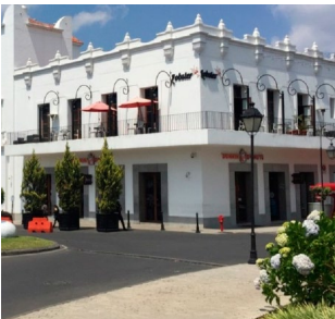
Arriba: avenida Escazú. Abajo: ciudad Cayalá.

La forma de pensar la ciudad ha cambiado. Se ha dado una profunda reestructuración de los significados, símbolos culturales y discursos urbanos. Concordando con el comentario de Soja (2000) sobre Chambers, se necesitan nuevas formas de pensar y hacer teorías sobre el espacio empíricamente percibido, conceptualmente percibido y vivido. Los nuevos espacios, como las mini ciudades, son una concentración cosmopolita de las culturas mundiales que los torna en hub de fusión y difusión.