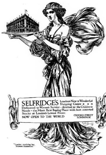
Figura 2 Ejemplo de publicidad de la tienda Selfridge's, en Londres a principios del siglo XX.