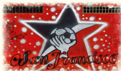
DETALLE MURALES ORIGINALES