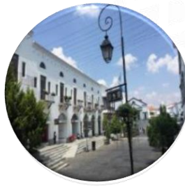
¿Son las miniciudades una fantasy city o una hiperrealidad?