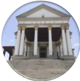
Breve historiografía del concepto “público”

Inicialmente nos cuestionamos si podríamos considerar las miniciudades como una forma de lifestyle centres , que se pueden analizar tanto como falsos espacios públicos, o como fakes adrede a partir de su oferta para diversos tipos de caminatas y desde el binomio peatón/espacio público .