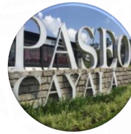
Reflexiones finales y conclusiones

V CONGRESO INTERNACIONAL ISUF-H COSTA RICA 2021