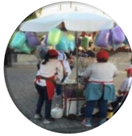
Espacio público se define por su uso, no por su estatuto jurídico