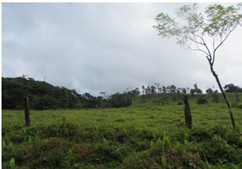
Figura 2 Zonas boscosas dentro del cantón de Guatuso

La deforestación también se ha dado en las zonas de protección de los ríos ocasionando erosión en sus márgenes. En la figura 3 se observa la falta de árboles en las orillas del río como soporte del suelo. En el caso del Río Frío el desprendimiento de material dificulta su navegación. La