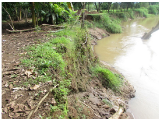
Figura 3 Deforestación en los márgenes del Río Frío