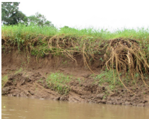
Figura 4 Sedimentación en el Río Frío

Adicionalmente, dicha sedimentación produce un efecto directo sobre la desembocadura del Río Frío en el humedal Caño Negro, unido al efecto de los agroquímicos vertidos en el río, producto de la actividad agrícola. Esto implica una seria afectación sobre este ecosistema.