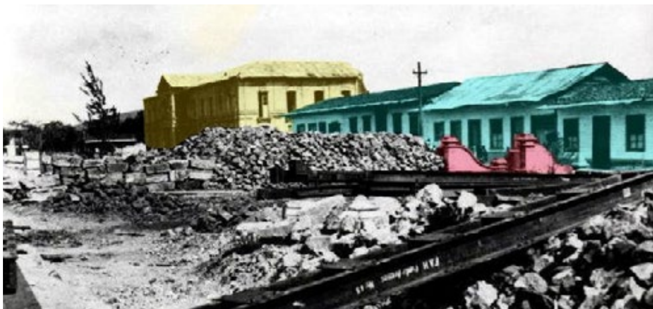
Figura 4. Construcción de la Parroquia de San Ramón actual, 1926

Nota. Resaltado en amarillo el antiguo Palacio Municipal, en celeste las casas aledañas, y en rojo algunos detalles arquitectónicos de la entrada a la antigua parroquia.