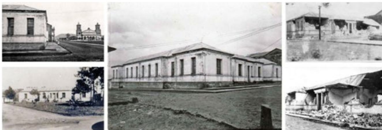
Figura 11. Collage de fotografías de la Escuela Central, inicios del siglo XX