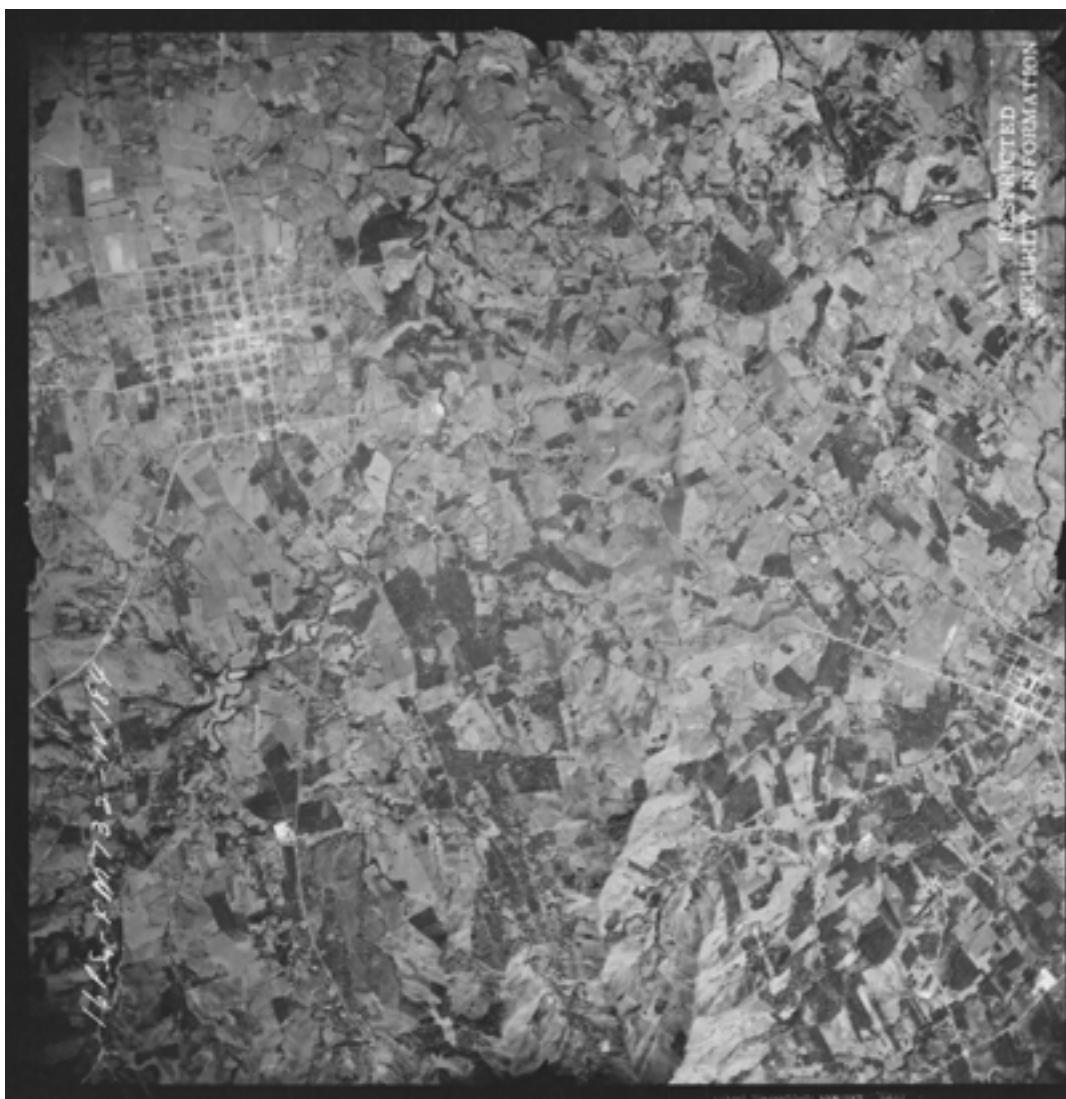
Figura 7. Plano aéreo de San Ramón y Palmares, 1945