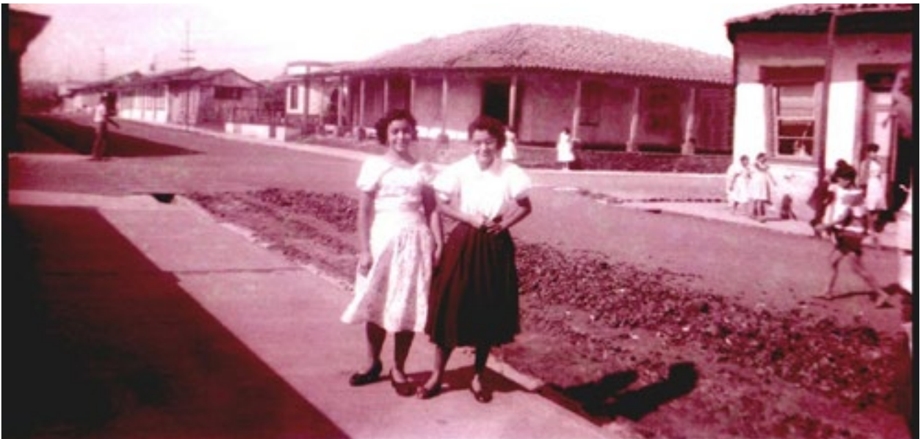
Figura 8. Al fondo, el primer hospital de San Ramón, esquina noreste de la Parroquia