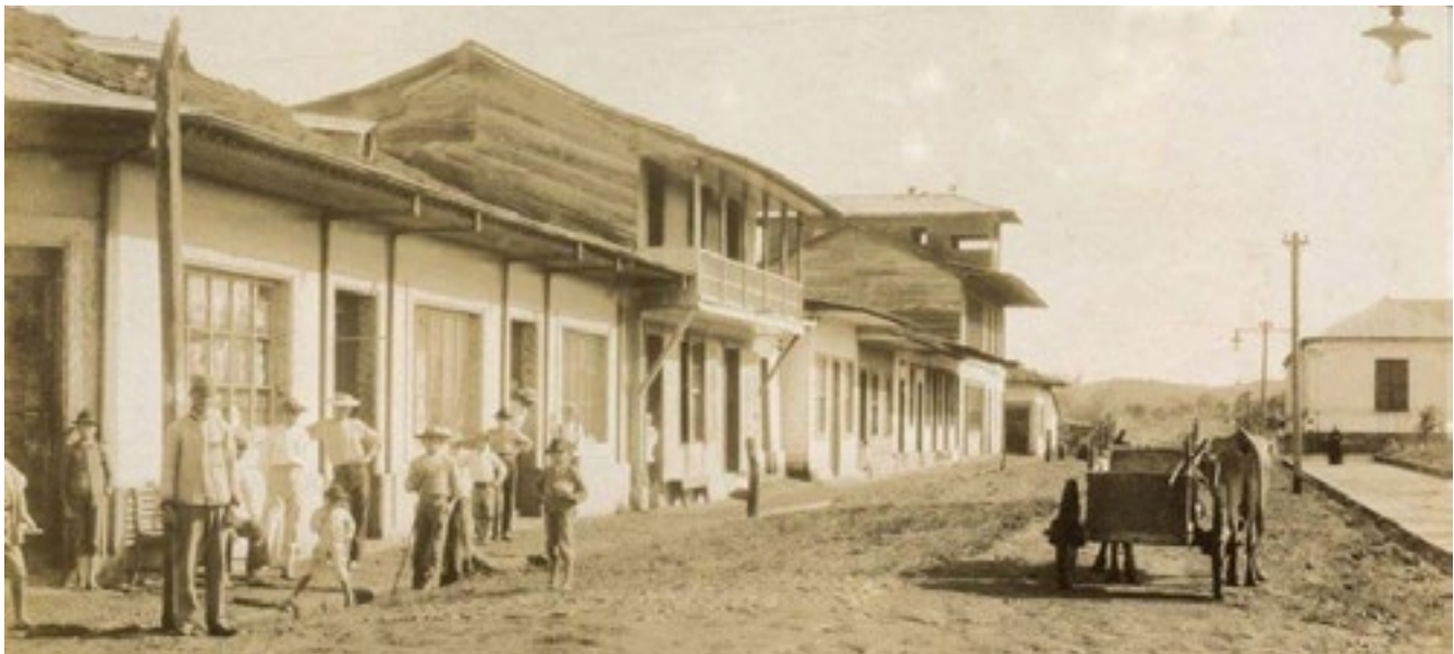
Figura 1. Costado oeste del parque Central de San Ramón, a inicios del siglo XX. Manuel Gómez Miralles