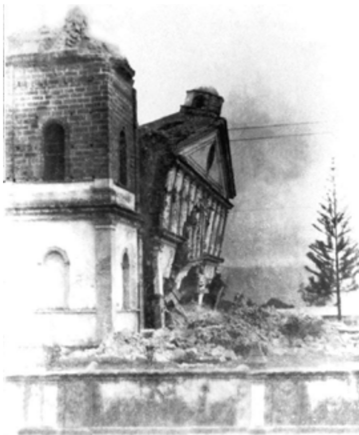
Figura 2. La demolición de la Parroquia de San Ramón, 1925