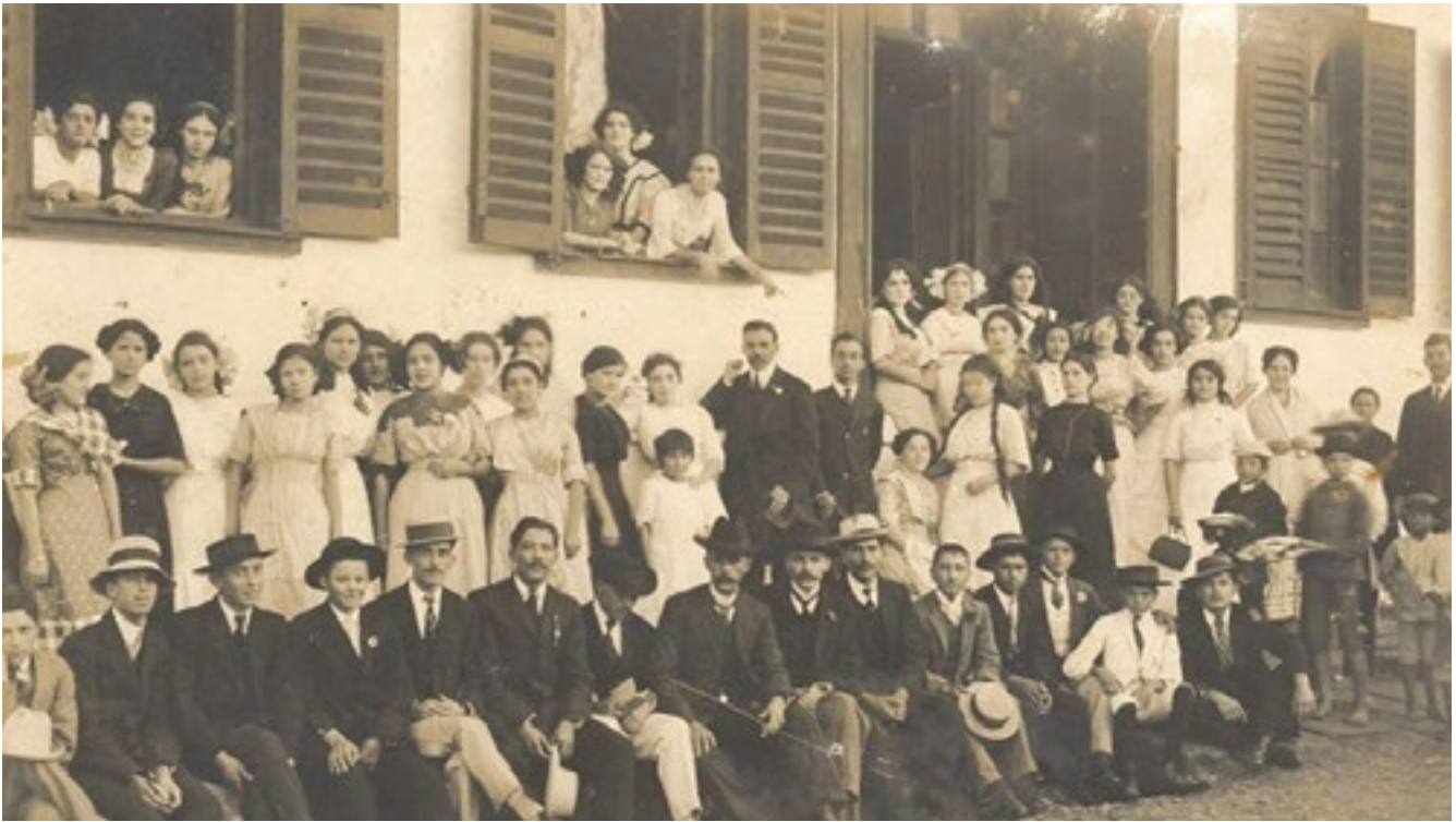
Figura 5. Retrato grupal de ramonenses de la época, inicios del siglo XX. Manuel Gómez Miralles

Fuente: Archivo fotográfico de Paul Brenes Cambroner.