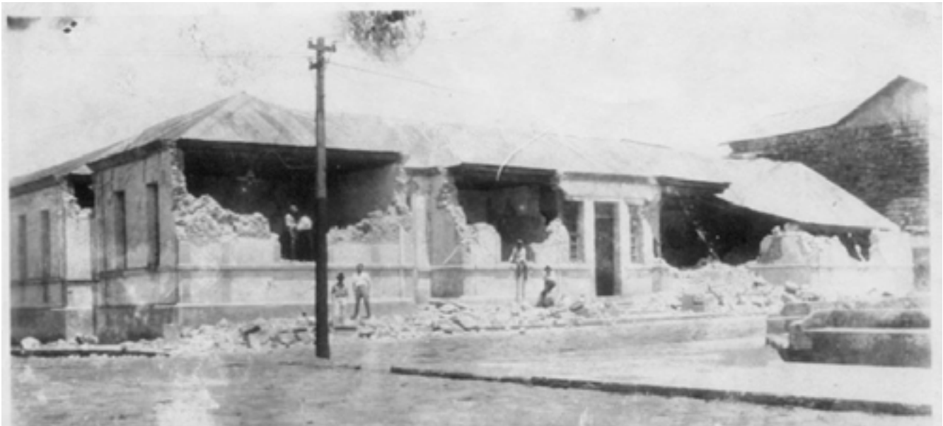
Figura 3. Antigua Escuela Central, 1924