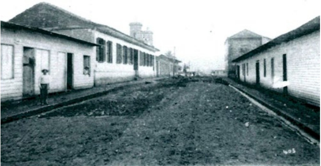
Figura 6. Calle Central de San Ramón, 100 metros norte de la Parroquia