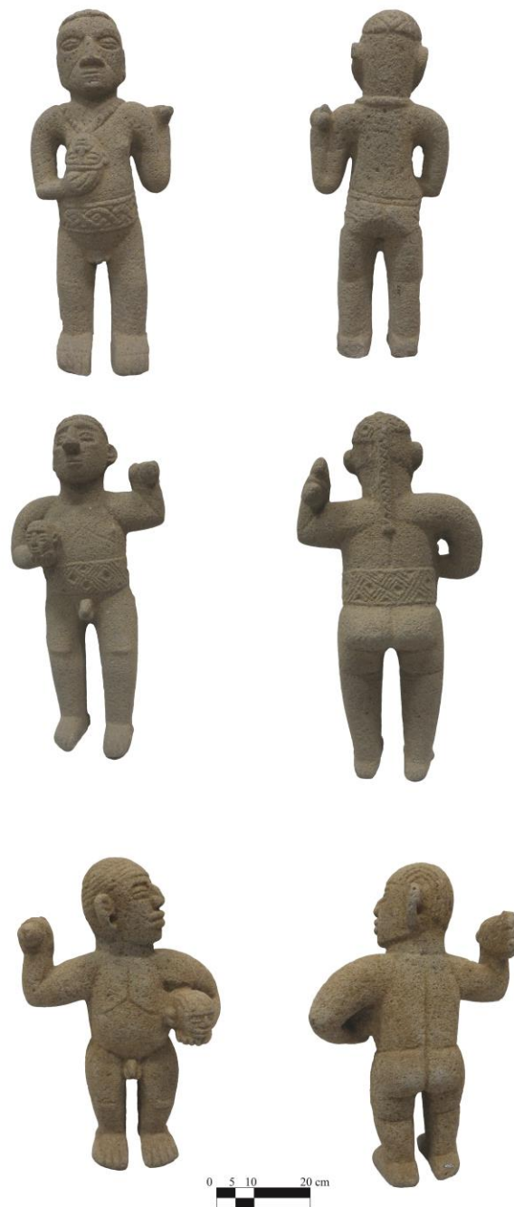
Imagen 2. Ejemplos ilustrativos de personajes exhibiendo y portando cabezas escindidas (“Tipo A” de Lines). Se pueden observar vistas frontales y posteriores de tres representaciones que demarcan distintos y complejos tocados (algunos cortos otros con el cabello largo), diferentes poses y formas de exhibir las cabezas escindidas y otros aspectos de corporalidad interesantes (e.g los fajones, orejeras). Las esculturas forman parte de la colección del Museo Nacional de Costa Rica y se ubican en el Departamento de Protección al Patrimonio Cultural de dicha entidad.