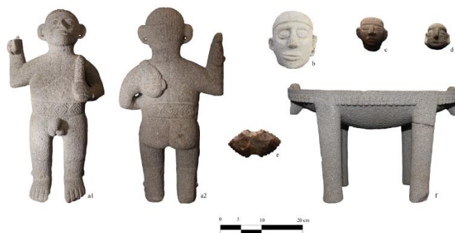
Imagen 6. Parte de la escultórica recuperada en el sitio Pascua. Composición basada en la Figura 73 (Naranjo et al., 2015, p. 155). a. Personaje representando la toma de cabezas (vista anterior y posterior); b., c. y d. cabezas efigie; e. Hacha doble acinturada dentada; f. Metate tetrápode decorado con estilizaciones de cabezas. a., b., e. y f. forman parte del mismo ajuar del contexto “RF2”; mientras c. del “RF12” y d. del “RF16”.

En síntesis, para el “RF2” (la sepultura compuesta) se halló en asocio una representación explícita de toma de cabezas (la cabeza escindida cuelga de la espalda de un personaje), una escultura de cabeza en bulto, un metate decorado y un hacha dentada; de los que se discutirá más adelante (imagen 6). Valga decir que el segundo objeto, el cual posee una base cilíndrica y plana, es descrito como “una cabeza trofeo” y cuyo corte de cabello fue “ejecutado por el captor como símbolo de dominación sobre su enemigo” (Naranjo et al., 2015, p. 151).