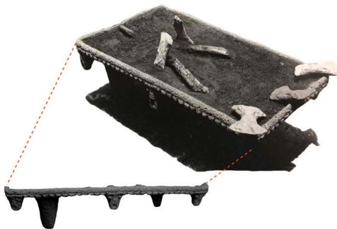
Imagen 7. Metate decorado con estilizaciones de cabezas en su borde y en cuyo plato se hallaron hachas enmangadas en fémures humanos, sitio CENADA (H26-CN).

Más allá de la simbolización y metaforizar la toma de cabezas (vía su representación esculpida en los bordes de los metates), no deja de llamar la atención hallazgos sorprendentes como el del sitio CENADA (H26-CN), localizado en Barrial de Heredia (imagen 7).