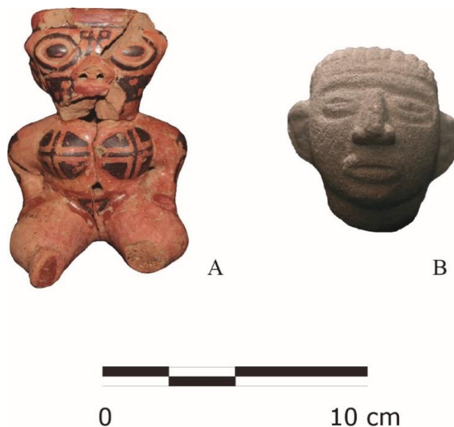
Imagen 5. A. Figurilla cerámica asociada al tipo Galo Policromo, propio del Período Bagaces (300-800 d.C.) de la Subregión Gran Nicoya; B. cabeza efígie. Ambos objetos fueron hallados en una tumba (“RF12”) del sitio Pascua. Composición basada en las Figuras 72 y 73 (Naranjo et al., 2015, pp. 149, 155). Las fotografías fueron facilitadas por Denis Naranjo Masís.

[...] una escultura de cabeza humana (art. N°1249). Posteriormente, hasta llegar a los 70 cm.b.s., se recuperó una figurilla cerámica (art. N°1199) asociada al tipo Galo policromo, adscrita al Período Bagaces (300-800 d.C.) de la Subregión Gran Nicoya [imagen 5]. La ofrenda se ubica entre rocas grandes y pequeñas, quedando un posible espacio para depositar el cuerpo (Naranjo et al., 2015, p. 108).