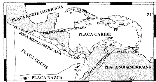
Fig. 1: Marco tectónico. FP: Fosa de Puerto Rico, CDNP: Cinturón Deformado del Norte de Panamá, ZSC: Zona de Subducción de Colombia (adaptado de Calais et al., 1992).

La región centroamericana y parte de las islas del Caribe, son parte de la placa Caribe. Esta placa se encuentra rodeada por las placas Cocos, Norteamericana, Nazca y Sudamericana (Fig. 1). Los tres límites tectónicos más importantes del área centroamericana son: La fosa Me-