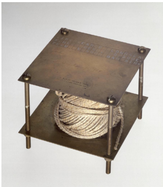
Imagen 9. À bruit secret (1916). Réplica hecha en 1964

Fuente: Musée National d'Art Moderne, Centre Georges Pompidou, París, Francia. Artists Rights Society (ARS), New York, 2014.