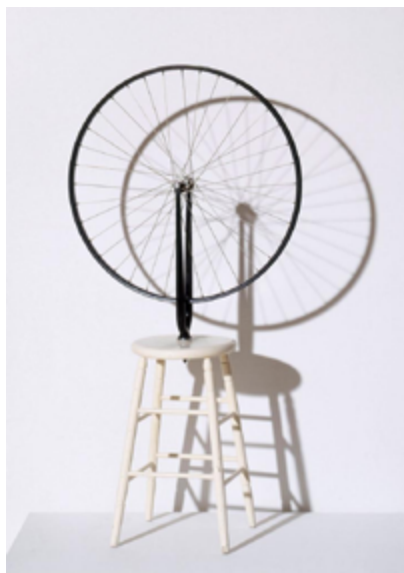
Imagen 4. Rueda de bicicleta sobre un taburete (1913). Réplica hecha en 1964.

Fuente: Musée National d'Art Moderne, Centre Georges Pompidou, París, Francia. Artists Rights Society (ARS), New York, 2014.