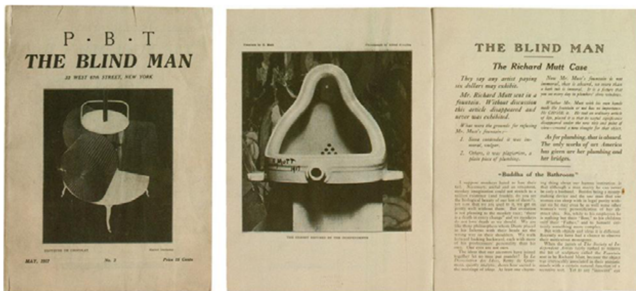
Imagen 8. The Richard Mutt Case. Cubierta y artículo de The Blind Man (1917)