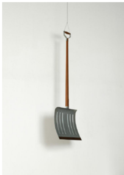
Imagen 3. Portabotellas (1914), Réplica hecha en 1964.

Fuente: Musée National d'Art Moderne, Centre Georges Pompidou, París, Francia. Artists Rights Society (ARS), New York, 2014.