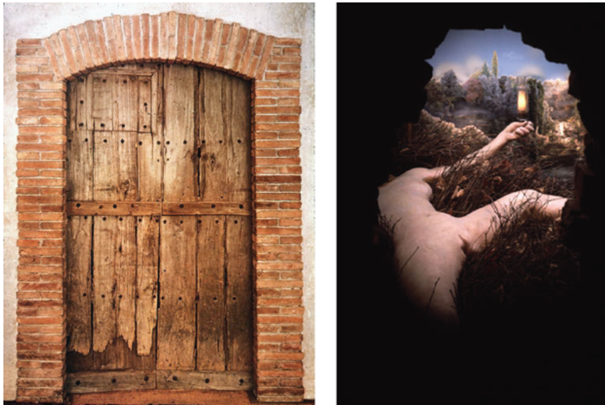
Imagen 2. Datos: 1° La cascada 2° El gas de alumbrado (1946-1966)

Fuente: Philadelphia Museum of Art, Artists Rights Society (ARS), New York, 2014.