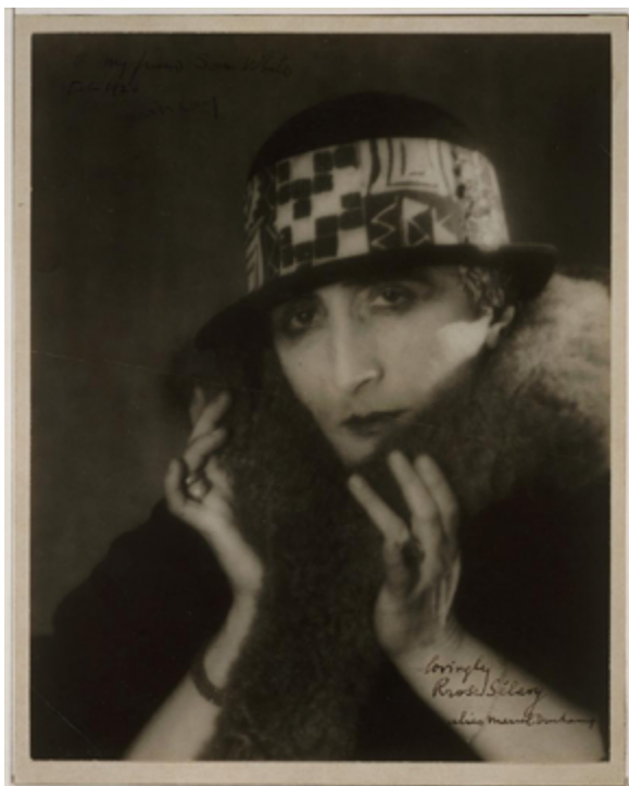
Imagen 10. Marcel Duchamp como Rose Sélavy (1920-1921)

Fuente: Philadelphia Museum of Art Philadelphia, Pennsylvania, Estados Unidos. Artists Rights Society (ARS), New York, 2014.