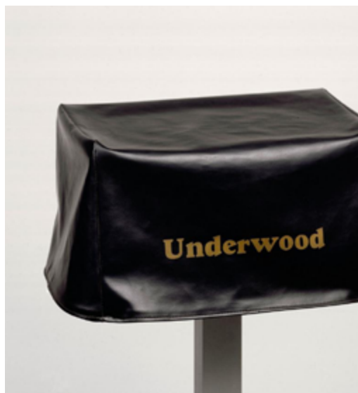
Imagen 6. Pliant de voyage (1916). Réplica hecha en 1964.