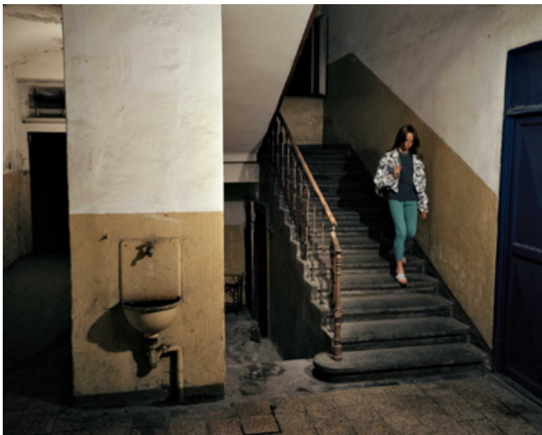
Imagen 11. Odradek, Táborská 8, Prague, 18 July 1994 (1994)

Fuente: Museum für Moderne Kunst, Frankfurt y Main, Alemania. Jeff Wall.