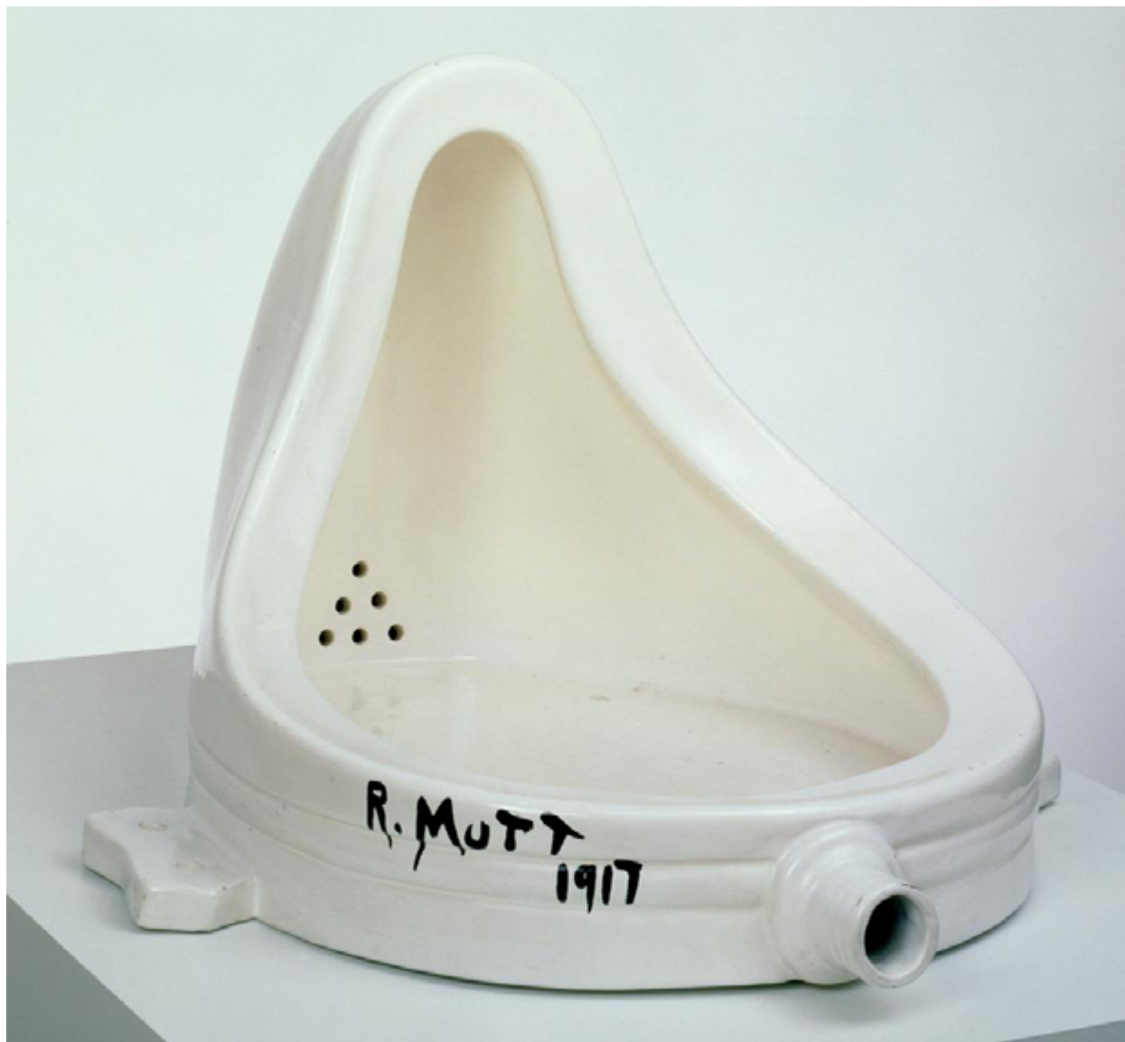
Imagen 1. Fuente (1917). Replica hecha en 1964. San Francisco