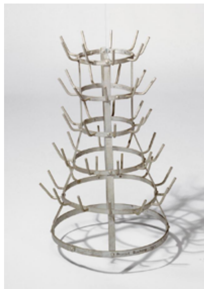
Imagen 5. In Advance of the Broken Arm (1915). Réplica hecha en 1964.

Fuente: Musée National d'Art Moderne, Centre Georges Pompidou, París, Francia. Artists Rights Society (ARS), New York, 2014.