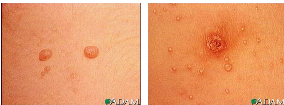
Fig.Nº 1 y 2 Lesiones típicas de molusco contagioso.

Las lesiones en los genitales inicialmente pueden confundirse con herpes o verrugas, la diferencia radica en que las lesiones del molusco no causan dolor o picazón (13).