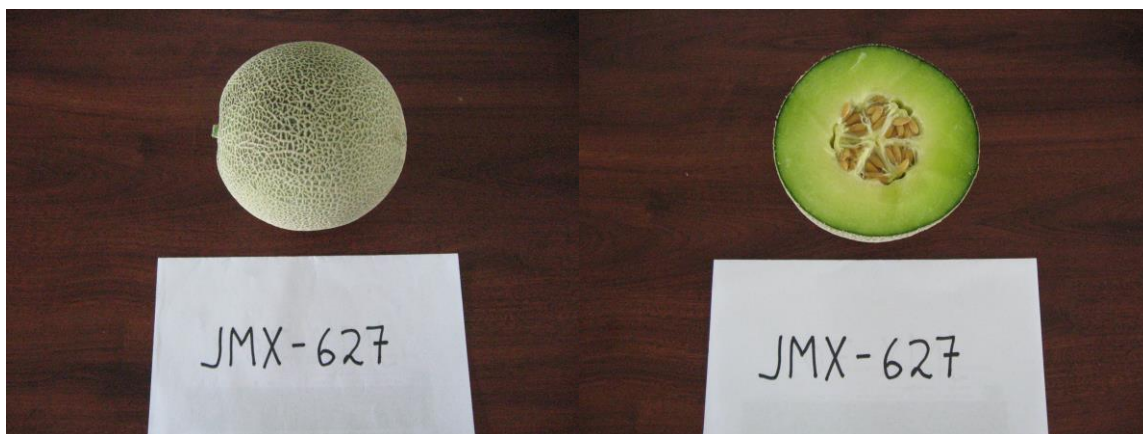
Figura 2. Melón JMX-627. Este genotipo también muestra una redcilla cerrada, así como pulpa verde.