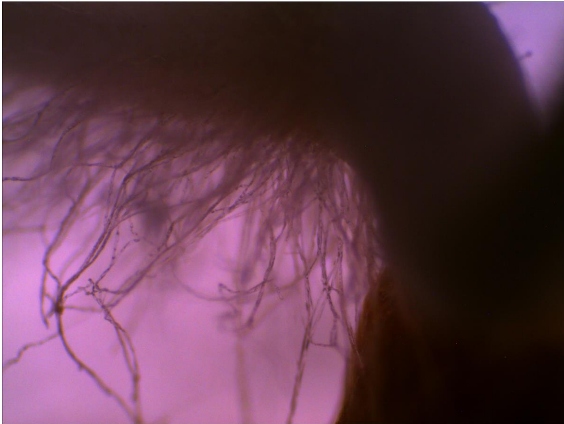
Figura 6. Semilla de berenjena en germinación. Detalle de los pelos absorbentes presentes en la zona de inicio de la radícula.

La información presentada en esta hoja divulgativa se generó en el proyecto de investigación denominado “Optimización de la producción de hortalizas en ambientes protegidos”, que fue financiado por la Universidad de Costa Rica.