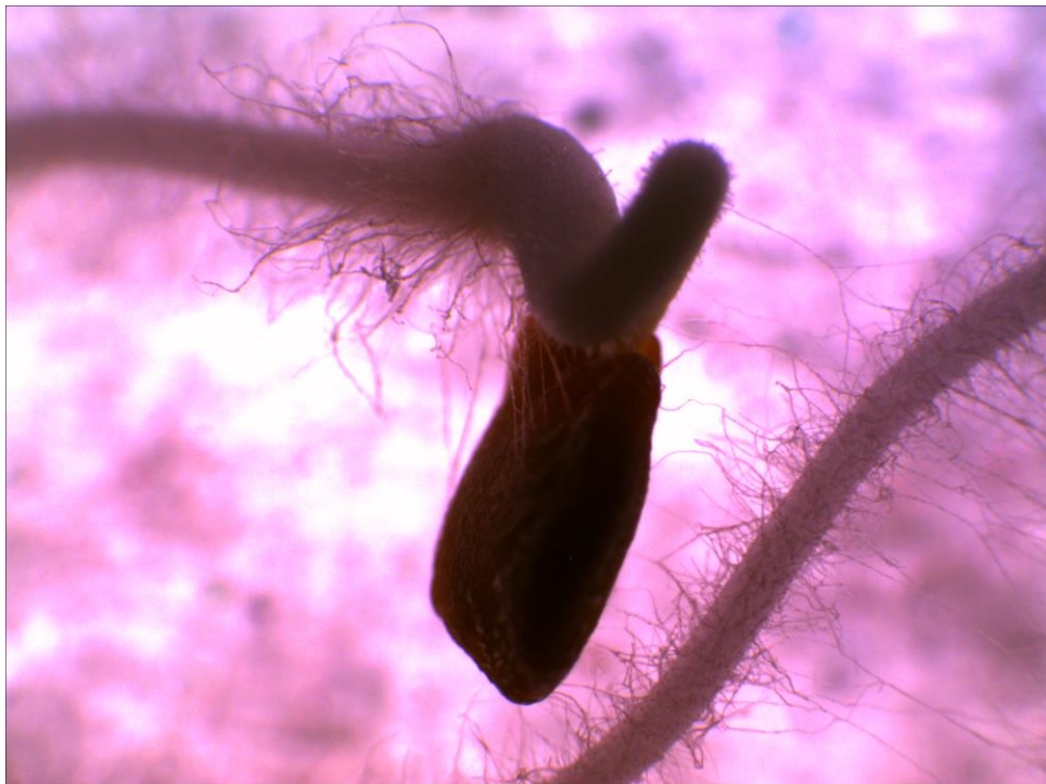
Figura 5. Semilla de berenjena en germinación. Se observa el hipocótilo y la radícula, con una densa presencia de pelos absorbentes.