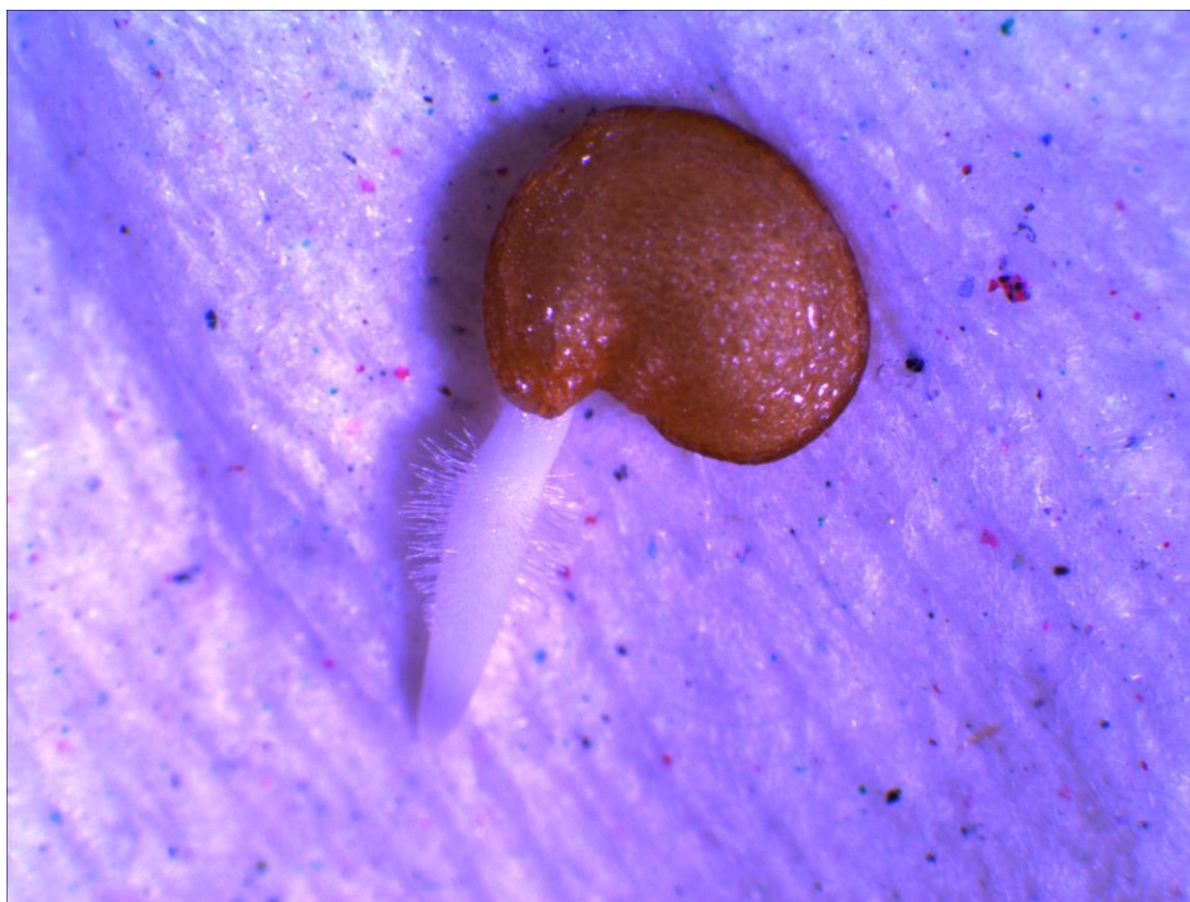
Figura 1. Semilla de berenjena en germinación. Se observan los pelos absorbentes de la radícula.

A continuación, se presentan las fotografías de semillas de berenjena en germinación, tomadas con un estereoscopio.