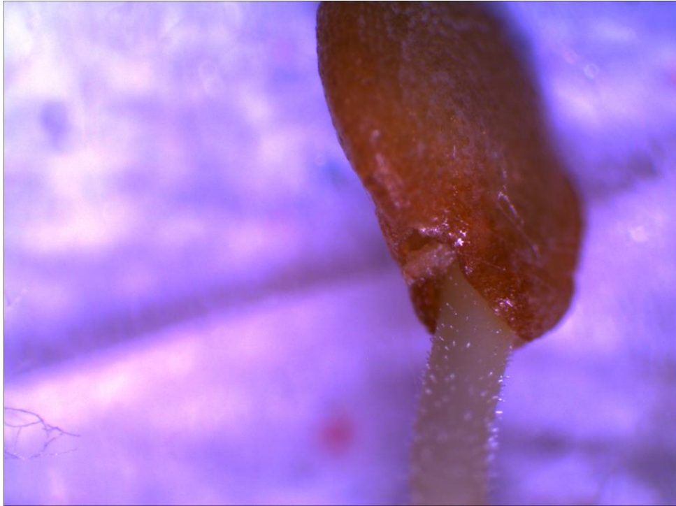
Figura 2. Semilla de berenjena en germinación. Se observa una leve vellosidad en el hipocótilo.