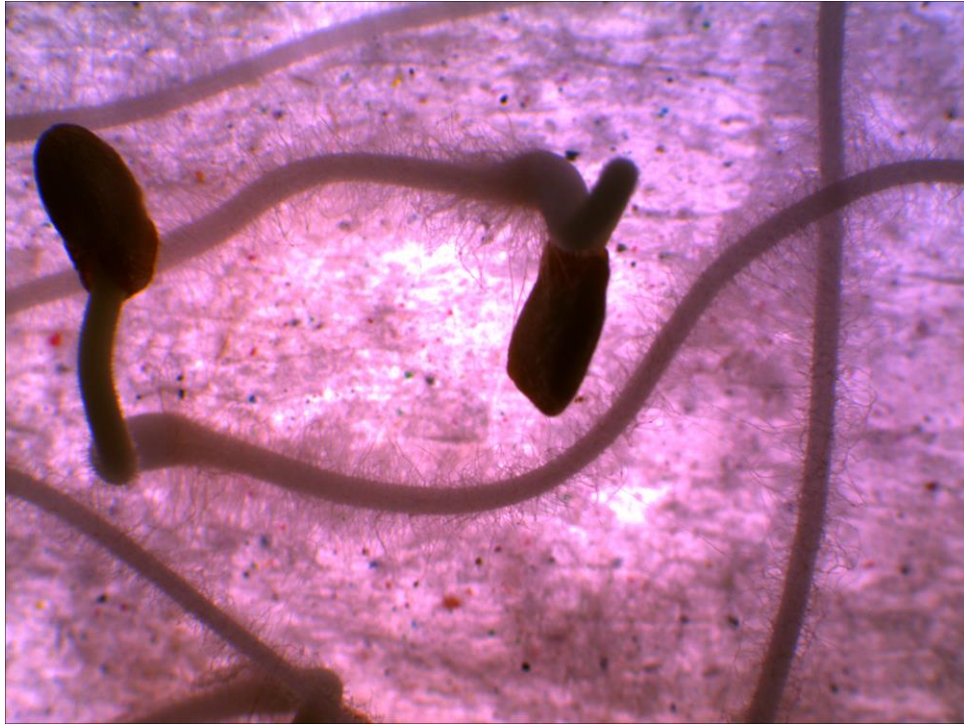
Figura 4. Semillas de berenjena en germinación. Se observa la densa presencia de pelos absorbentes.