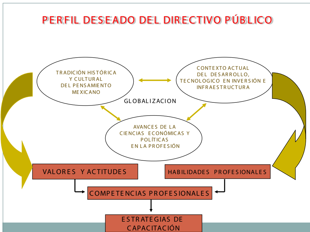
Figura 3 Perfil deseado del directivo público

Este concepto fundamenta el sistema, y se identifica con que “hacerlo bien” en el puesto de trabajo no solamente está asociado a los conocimientos y habilidades que se posean, sino “...que está ligado a las características y cualidades propias de los directivos públicos, a su competencia”. En la práctica de la dirección, donde se establecen relaciones permanentes y directas con diversas personas en disímiles situaciones.