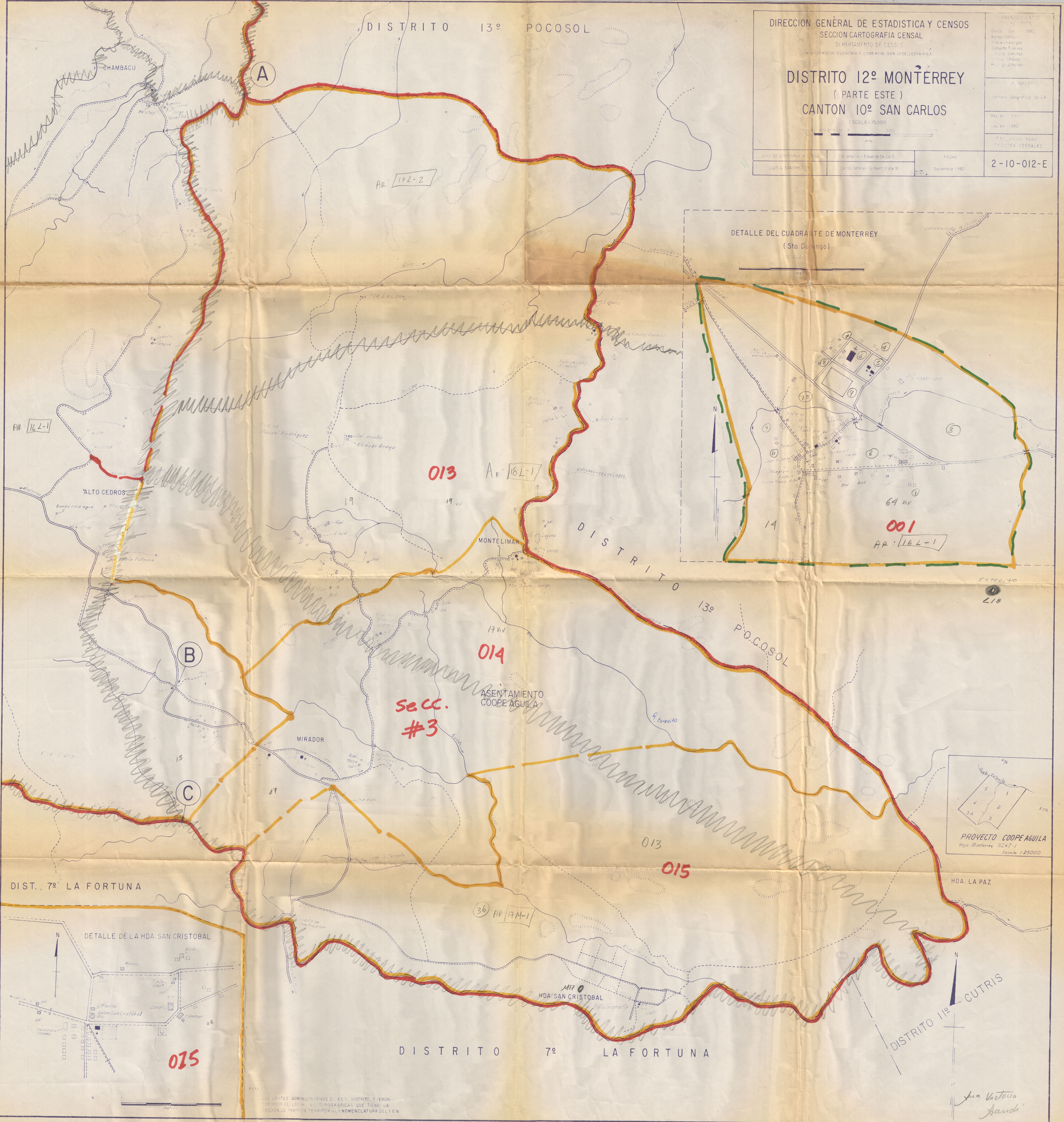
DETALLE DEL CUADRANTE DE MONTERREY ( Sto. Domingo )

INSTITUTO GEOGRAFICO DE CR Hecho en 1982 Ley en 1982 EXCLUSIVO PARA EFECTOS CENSALES