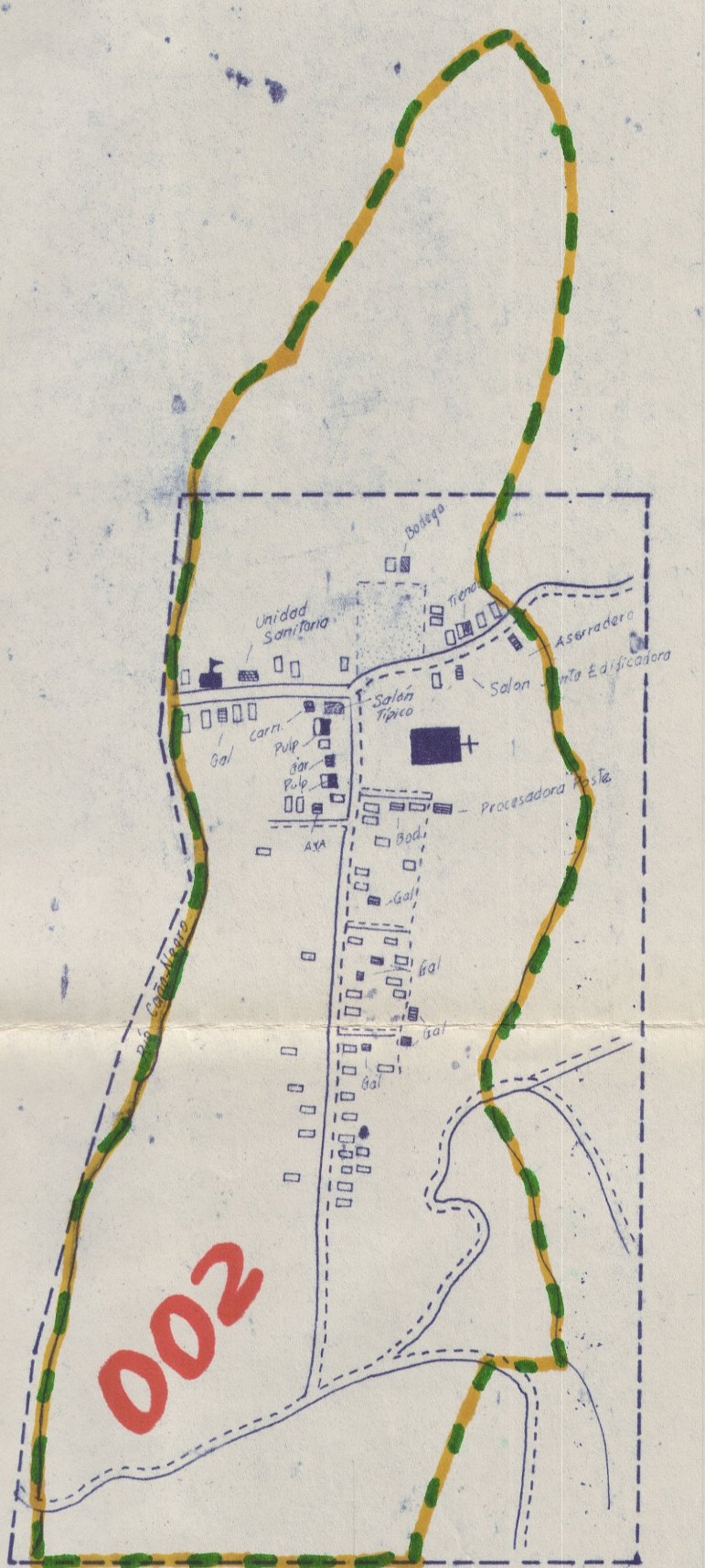
DETALLE "C" SANTA RITA