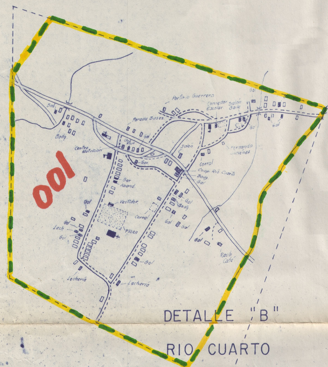
DETALLE "B" RIO CUARTO