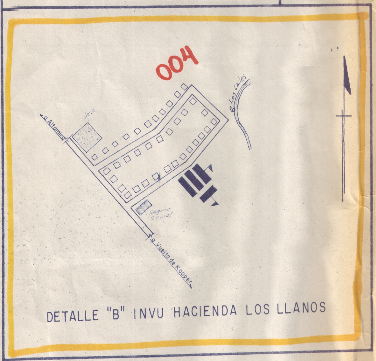
DETALLE "B" INVU HACIENDA LOS LLANOS