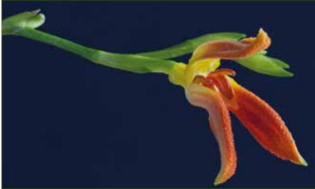
17. Specklinia remotiflora , Holotyp (BOGARÍN 8181), gesammelt in den Berglagen der Talamanca-Gebirgskette in Costa Rica nahe der Grenze zu Panama

17. Specklinia remotiflora , holotype (BOGARÍN 8181), collected in the high mountains of the Talamanca range in Costa Rica, close to the Panamanian border (JBL-spirit)