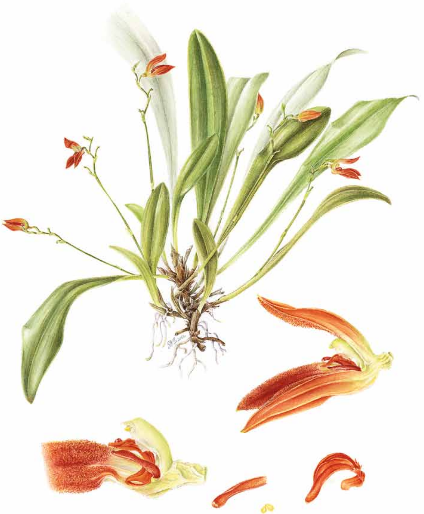
18. Aquarell von Specklinia remotiflora , Typus KARREMANS 4024 (JBL-spirit) 18. Botanical watercolor of Specklinia remotiflora , based on KARREMANS 4024 (JBL-spirit) Illustration: Sylvia Strigari