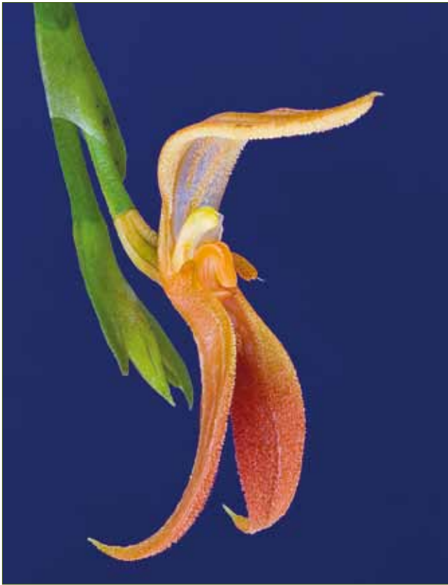
13. Specklinia endotrachys , gesammelt von M. BLANCO (961) auf der pazifischen Seite der Tilarán-Gebirgskette in Costa Rica (JBL-spirit)

13. Specklinia endotrachys , based on a specimen collected by M. BLANCO (961) on the Pacific drainage of the Tilarán mountain range in Costa Rica (JBL-spirit)