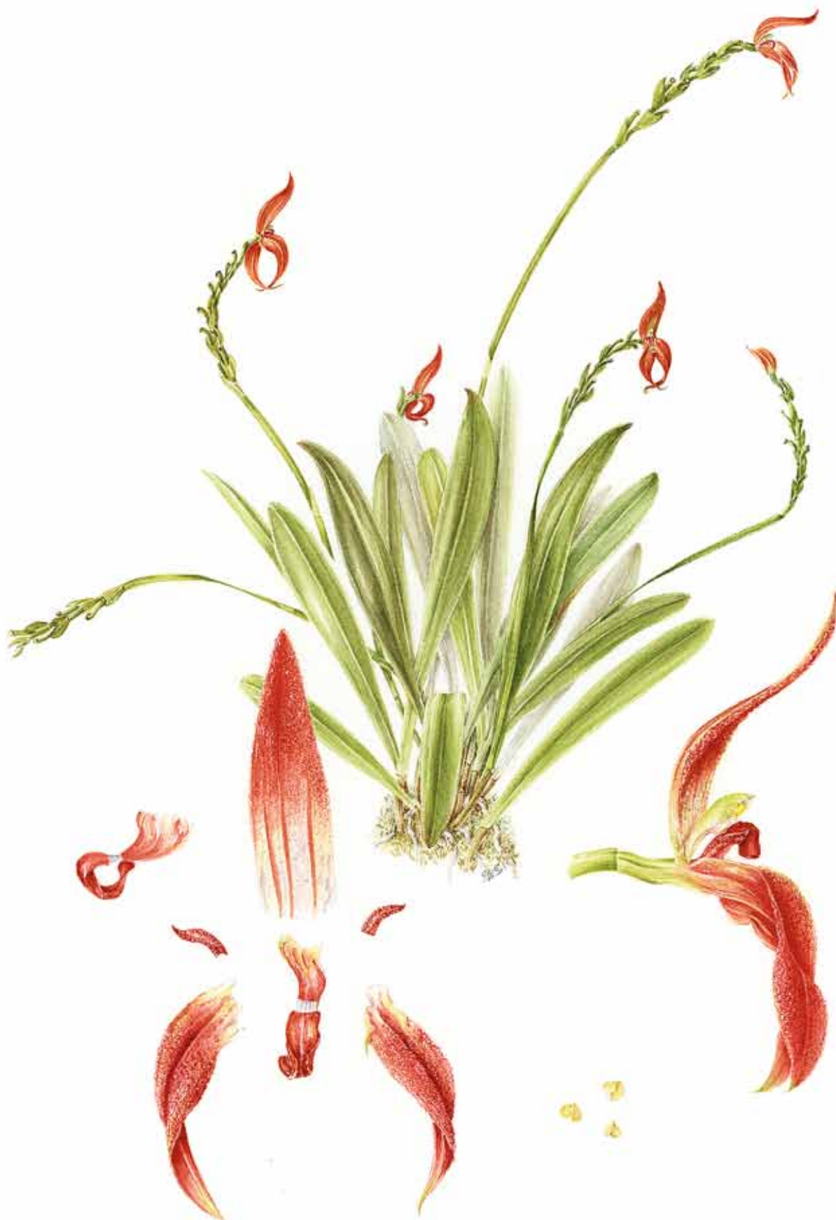
15. Aquarell von Specklinia spectabilis , Typus JBL-02532 (JBL-spirit) 15. Botanical watercolor of Specklinia spectabilis , based on JBL-02532 (JBL-spirit) Illustration: Sylvia Strigari