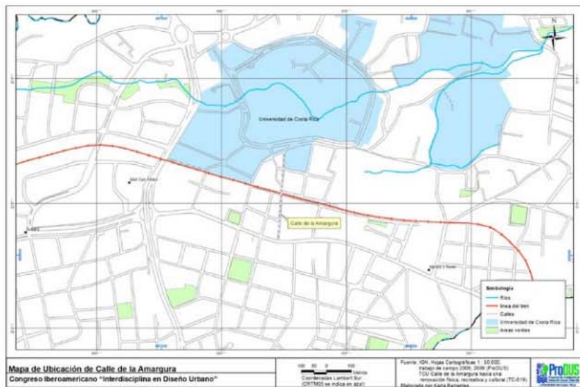
Figura 1. Localización de la Calle de la Amargura en San Pedro de Montes de Oca.

Sin embargo, otros eventos coyunturales como la Segunda Guerra Mundial, afectaron el negocio del café y se urbanizaron tierras otrora cafetaleras. De esta forma hubo un cambio en el uso del suelo, se aumentó la actividad industrial y en 1940 se crea la Universidad de Costa Rica, que provoca nuevas actividades relacionadas con usos educativos.