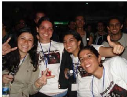
Fotografías 10 y 11. Equipo del TC-519 en diferentes momentos, 2007 y 2008 respectivamente