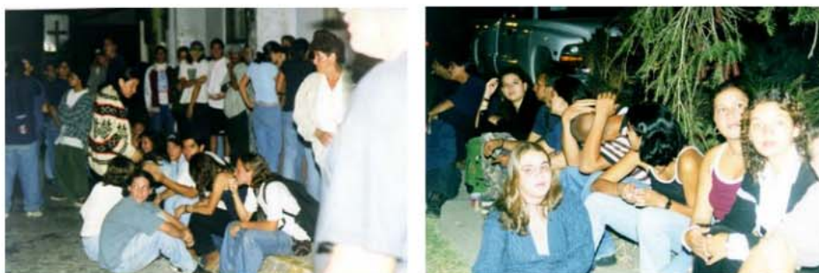
Fotografías 6 y 7. Jóvenes compartiendo en la Calle de la Amargura en 1997

c. Vinculación de actores sociales con el proyecto: En este eje de trabajo se busca la integración con otros actores destacados el proceso de transformación, este punto contiene un componente de investigación importante, además de la vinculación con otros grupos o individuos en el contexto de la Calle de la Amargura, se llevan a cabo encuestas de percepción de usuarios y usuarias, las cuales se realizan desde el año 2005 a la fecha (2013), además se efectúan sondeos sobre actividades específicas a la población beneficiaria. Como parte de este componente de trabajo el TC-519 ha sido parte de diferentes redes, dentro de las que se puede mencionar: Centros de Estudios Locales en epidemiología de drogas de Montes de Oca (CEL), parte del proyecto “Redes para la convivencia comunidades sin miedo” con el enlace de ONU-Hábitat, parte de las agendas de Espacio Público, Cultural y Niñez y adolescencia de Montes de Oca. Además de esta vinculación ha existido un estrecha relación con la oficina de Desarrollo Social de la Municipalidad de Montes de Oca, que ha servido de puente para llegar a diferentes grupos organizados de la comunidad.