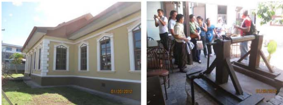
Fotografías 1 y 2. Patrimonio histórico arquitectónico en la Calle de la Amargura. La primera fotografía corresponde a la primera escuela de San Pedro, la segunda a un pozo de la estación ferroviaria. Taller del TC-519 sobre patrimonio tangible e intangible en la Calle de la Amargura.

Como ya se señaló la Calle de la Amargura presenta diferentes facetas, a través del tiempo se ha transformado hacia un tipo determinado de entretenimiento, hace más de 20 años este espacio se caracterizaba por ser un punto de encuentro y tertulia, con una diversidad de espacios que eran parte de las distintas corrientes de pensamiento, sin embargo, poco a poco esa riqueza cultural se ha ido perdiendo, ofreciendo a los y las jóvenes una misma oferta de entretenimiento.