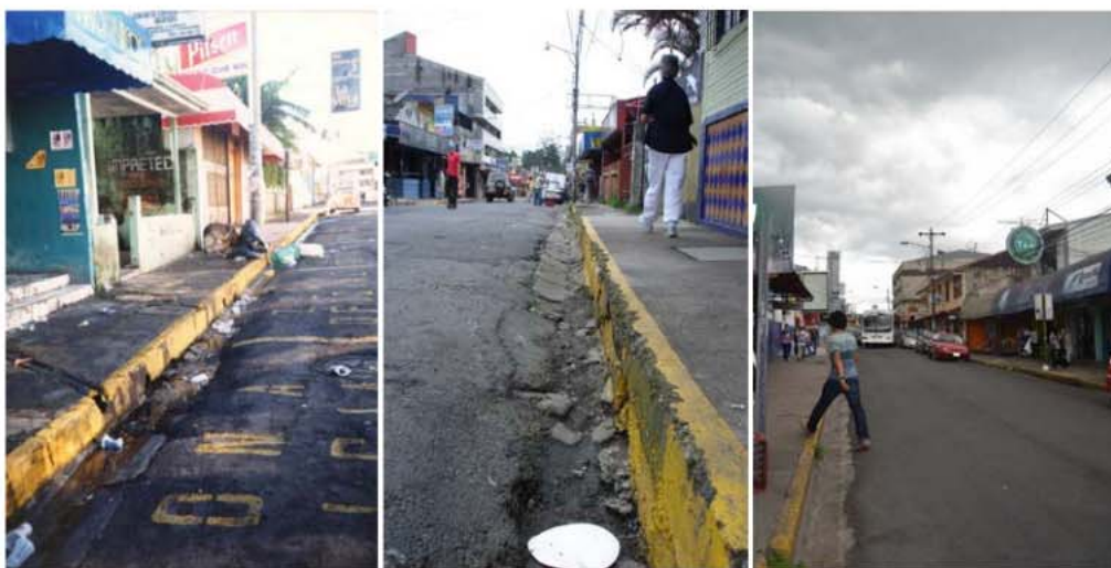
Fotografías 3, 4 y 5. Calle de la Amargura en 1997, 2007 y 2013, respectivamente

De esa esquina de la Municipalidad te venís aquí a la línea, es eso nada más, vos caminás, yo le digo una cosa, yo prefiero mil veces pasar por ahí de noche que venirme por aquí por el Vargas Calvo, yo digo “ay mirá hay gente afuera” 5 (Eugenia Muñoz, 2004, vecina de la Calle de la Amargura)