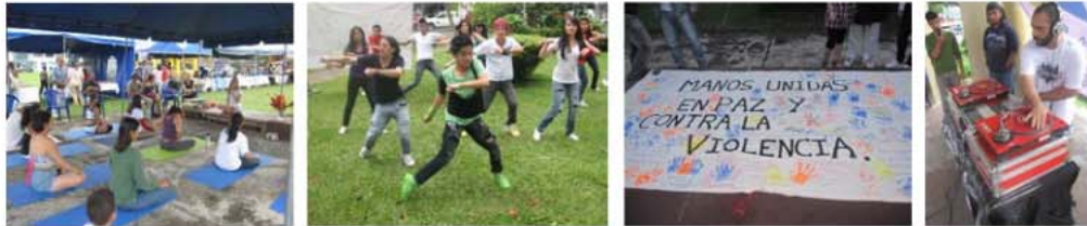
Fotografías 16, 17,18 y 19. Algunas actividades del Festival Montes de Oca Respira, 2010.

Como parte de estas alianzas en el año 2012 hubo un acercamiento con el colectivo Pausa Urbana, un grupo de multidisciplinario independiente que trabaja en la reactivación del espacio público, donde en conjunto con el TC-519 y la oficina de Desarrollo Social de la Municipalidad de Montes de Oca 7 , se creó el proyecto “Disfrutando la Amargura” 8 , como parte de un esfuerzo colectivo.