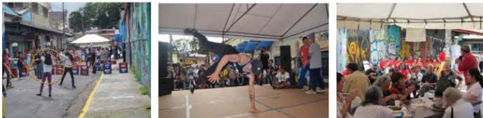
Fotografías 20, 21 y 22 . Algunas actividades Disfrutando la Amargura, dedicada a los niños en agosto 2013, en abril 2013 a expresiones urbanas y julio 2013 a los adultos mayores.