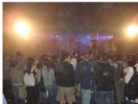
Fotografías 14 y 15. Algunas actividades del TC-519 en el 2007

En dicho proceso se celebraron actividades recreativas, deportivas, artísticas, capacitaciones, entre otras, en todos los distritos de Montes de Oca, se involucró a las asociaciones de desarrollo de las comunidades, escuelas y colegios públicos, colectivos de artistas e instituciones públicas, dentro de las cuales se pueden citar: Municipalidad de Montes de Oca, Universidad de Costa Rica, TCU Calle de la Amargura hacia una renovación física, recreativa y cultural, la fundación el Arte de vivir, Epicentro Urbano, Ministerio de Seguridad Pública, Ministerio de Salud, Viceministerio de Justicia y Paz, Comité de la persona joven, ONU-Hábitat, entre otros.