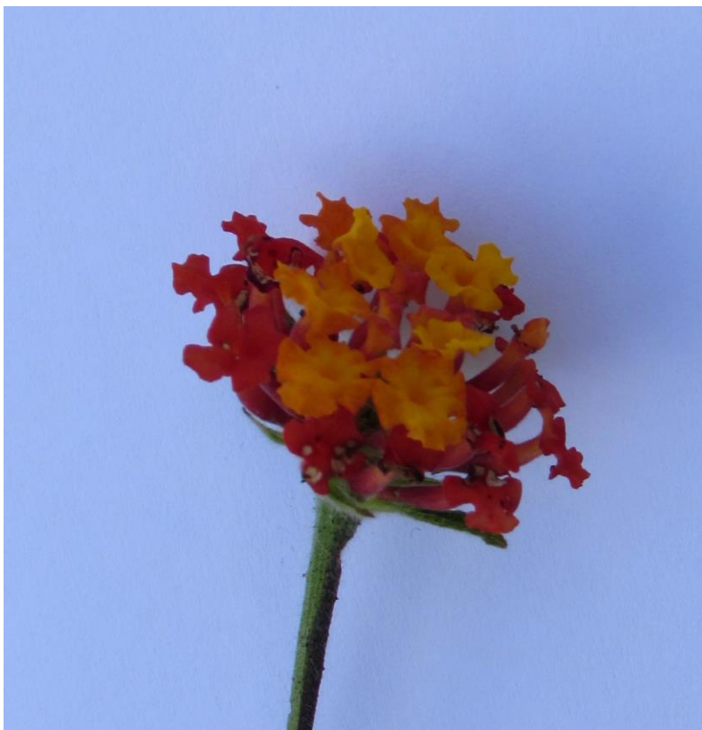
Figura 4. Detalle de la inflorescencia (en forma de cabezuela) de cinco negritos, en plena antesis.