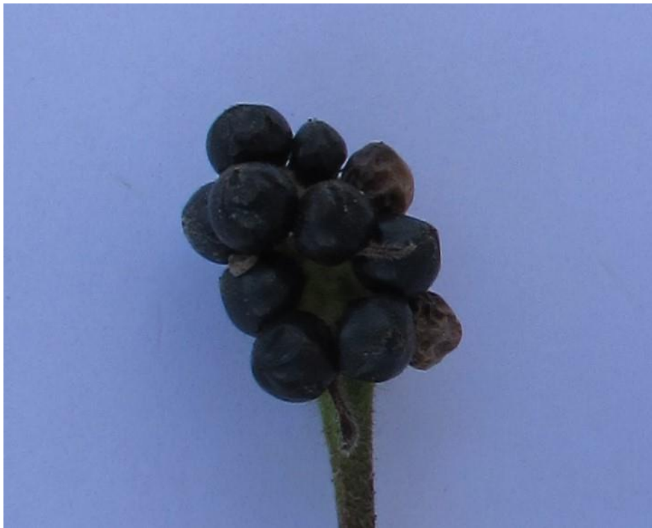
Figura 7. Detalle de frutos maduros de cinco negritos; son esféricos, negros, jugosos y carnosos.