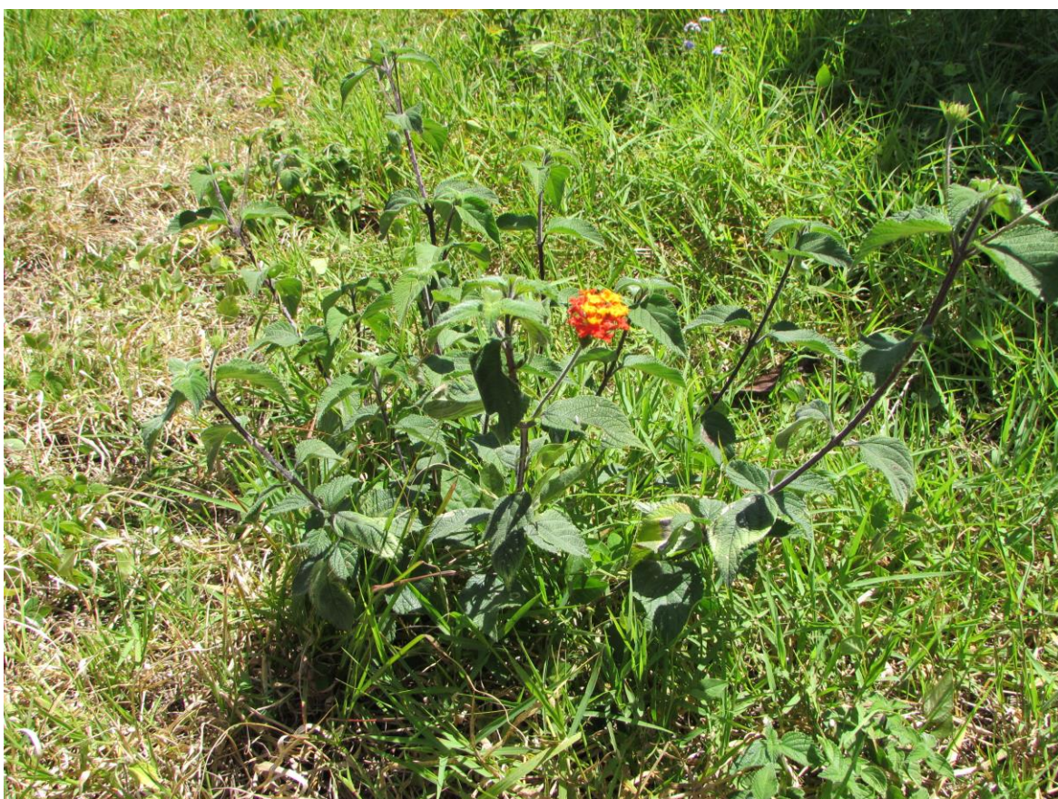
Figura 1. Planta de cinco negritos creciendo en un pastizal.

A continuación, se presentan algunas características morfológicas de las plantas de cinco negritos.