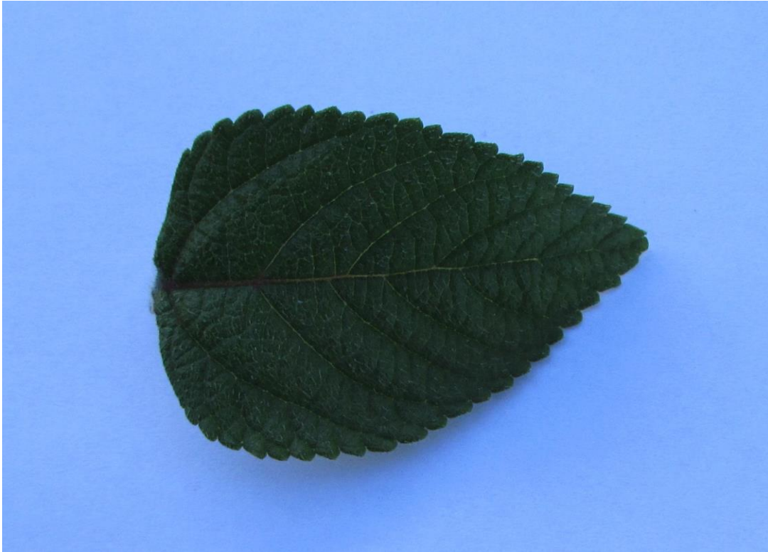
Figura 2. Hoja de la planta de cinco negritos, con su característico margen aserrado con dientes redondeados.