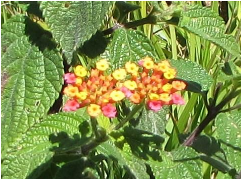
Figura 3. Inflorescencias de cinco negritos.