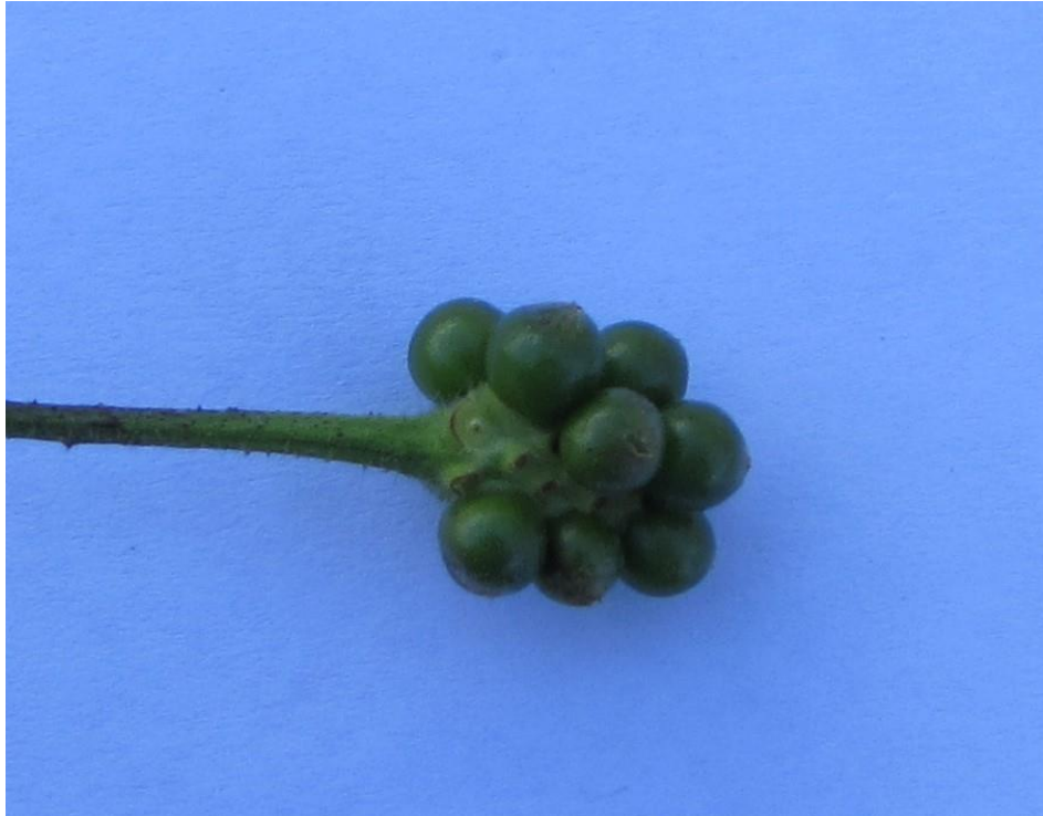
Figura 6. Detalle de frutos inmaduros de cinco negritos; los frutos son agrupados.