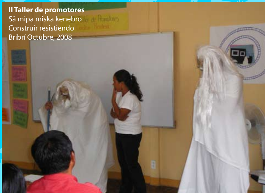
II Taller de promotores Sâ mipa miska kenebro Construir resistiendo Bribri Octubre, 2008