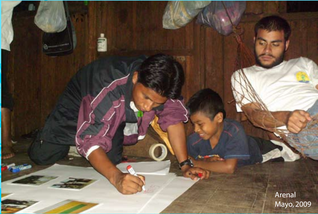
Arenal Mayo, 2009