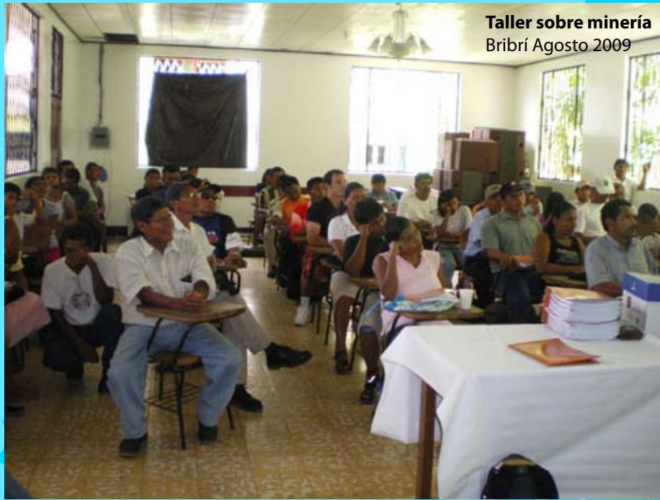
Taller sobre minería Bribri Agosto 2009