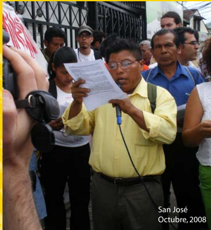
San José Octubre, 2008