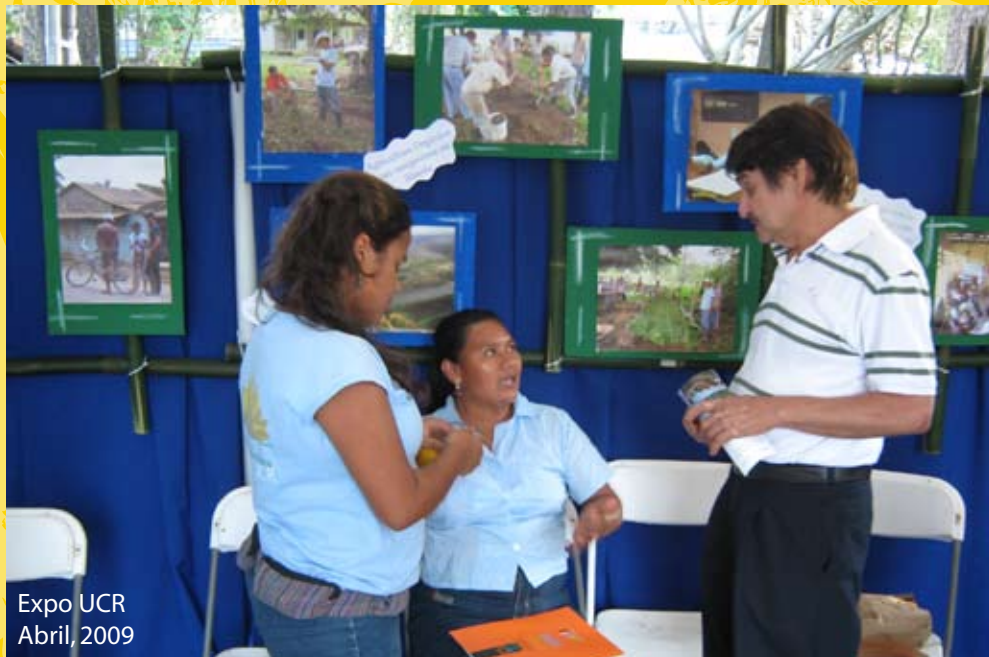
Expo UCR Abril, 2009