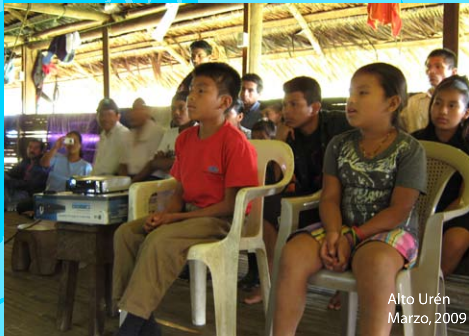
Alto Urén Marzo, 2009