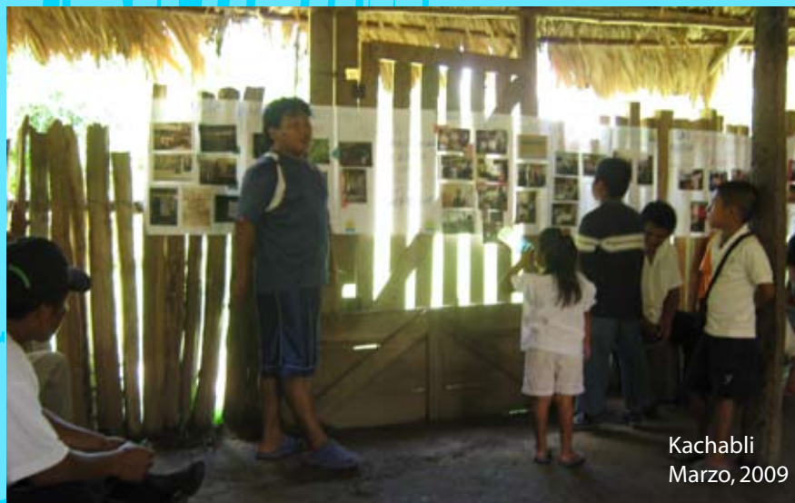
Kachabli Marzo, 2009

Todo lo acumulado por las y los promotores en la construcción del "buen vivir" ha sido informado y retroalimentado por las comunidades de Kachabli, Mleruk y Arenal, al utilizar herramientas visuales elaboradas por este mismo grupo.